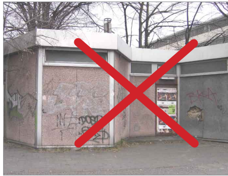
Abriß der desolaten Toilettenhäuser

Die noch in diesem Jahr vorhandenen Mittel des „Aktiven Stadtzentrums“ werden in kleinteilige Projekte fließen, deren Durchführung auch unabhängig von einem übergeordneten Gesamtkonzept sinnvoll ist. So werden die in diesem Newsletter genannten Projekte aus Mitteln des „Aktiven Stadtzentrums“ gefördert. Darüber hinaus ist vorgesehen, noch in diesem Jahr zwei seit langem geschlossene Toilettenhäuser im Ottopark und an der Stromstraße abzureißen. Weitere Mittel sollen in die Ersatzpflanzung von Straßenbäumen und die Überarbeitung von vielfach beschädigten oder „in die Jahre gekommenen“ Sitzbänken in den Straßenräumen und Parkanlagen fließen.