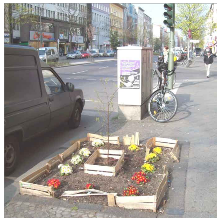
Ersatzpflanzungen von Straßenbäumen