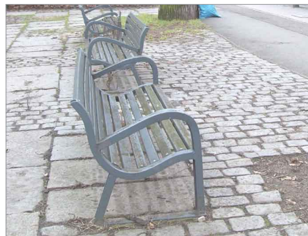
Überarbeitung von Sitzbänken