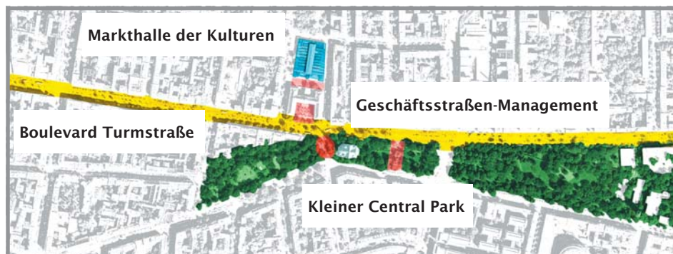
Handlungsfelder aus dem Entwicklungskonzept

• „Geschäftsstraßenmanagement“ Professionelles, außenwirksames Marketing und Promotion der Geschäftsstraße und Förderung der Vernetzung der Gewerbetreibenden und von kulturellen und sozialen Einrichtungen.