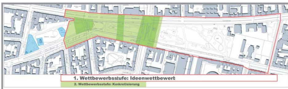
Abgrenzung des Wettbewerbsgebiets

kehrsgutachtens, da in den zu vertiefenden Abschnitten viele Berührungstellen zwischen der Straßenraumgestaltung und der Gestaltung des Grünzugs bestehen. Daher kann der landschaftsplanerische Wettbewerb erst im Sommer ausgelobt werden, wenn erste Ergebnisse des Verkehrsgutachtens vorliegen. Die Ideen der ersten Wettbewerbsstufe sollen voraussichtlich im Spätsommer der Öffentlichkeit vorgestellt werden. Die Prämierung und öffentliche Vorstellung der Beiträge der zweiten Wettbewerbsstufe wird zum Jahresende erfolgen.